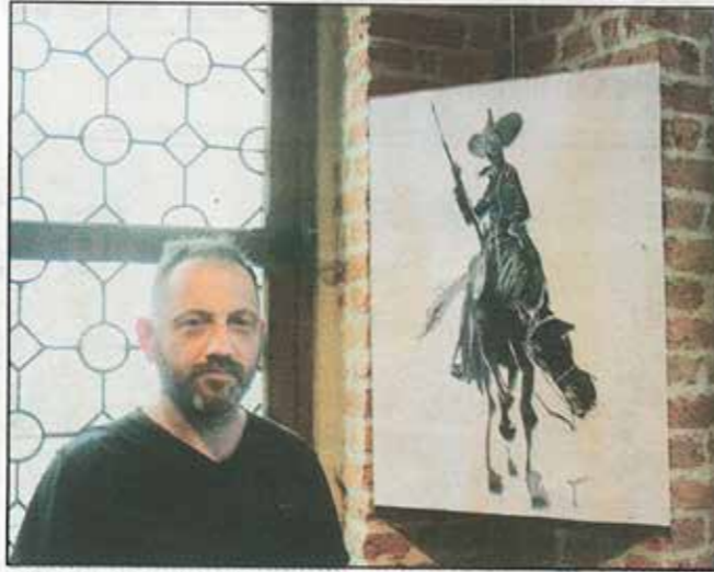
Hell West imaginé par Fred Vervish.