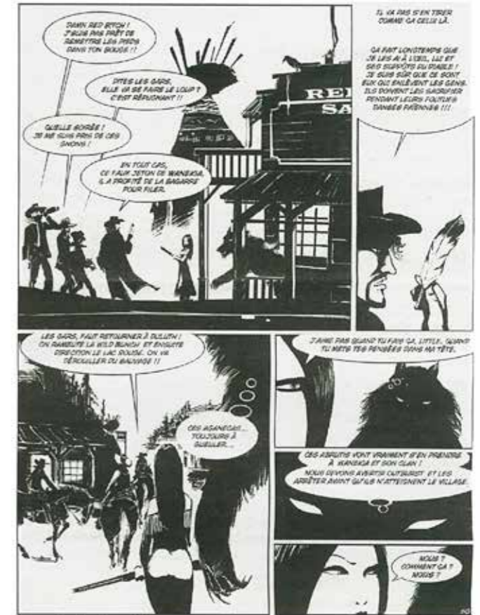
Une planche de Hellwest.

Au Bailliage, l'exposition de Fred Vervish se termine le 20 juillet, mais avant cela l'illustrateur de bande dessinée revient à Aire-sur-la-Lys pour dédicacer ses albums le samedi 5 juillet de 14h à 18h à la galerie du Bailliage. Cette dédicace est organisée en partenariat avec la locale. Suite à la demande de certains visiteurs, des tirages numériques des œuvres exposées ont été réalisés et pourront également être paraphés à cette occasion.