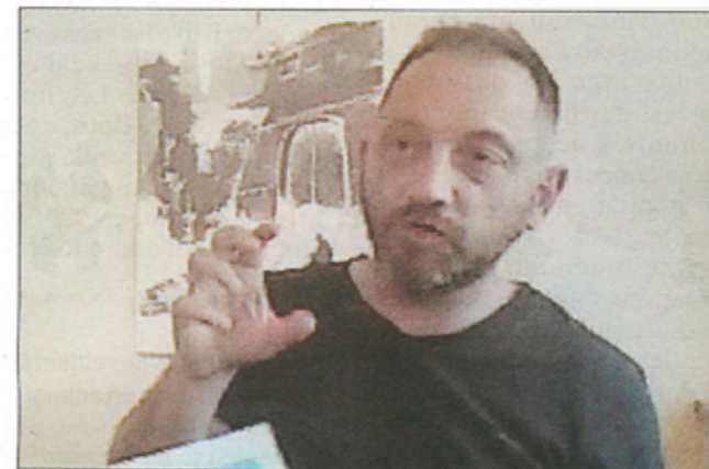
Samedi 5 juillet, l'artiste Fred Vervish dédicacera ses albums à la galerie du Bailliage.

■ L'exposition Fred Vervish se termine le 20 juillet mais avant cela Fred Vervish revient à Aire-sur-la-Lys pour dédicacer ses albums. Ce sera le samedi 05 juillet de 14 à 18h à la galerie du Bailliage. Cette dédicace est organisée en partenariat avec la Librairie du Beffroi. Aussi, suite à la demande de certains visiteurs, des tirages numériques des œuvres exposées ont été réalisés. L'artiste les signera ce même samedi.